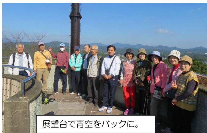
展望台で青空をバックに。