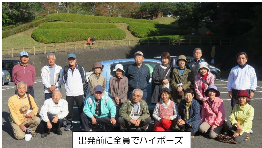
出発前に全員でハイポーズ