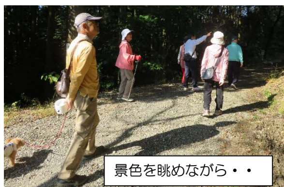
景色を眺めながら・・・