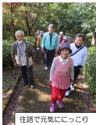
往路で元気ににっこり